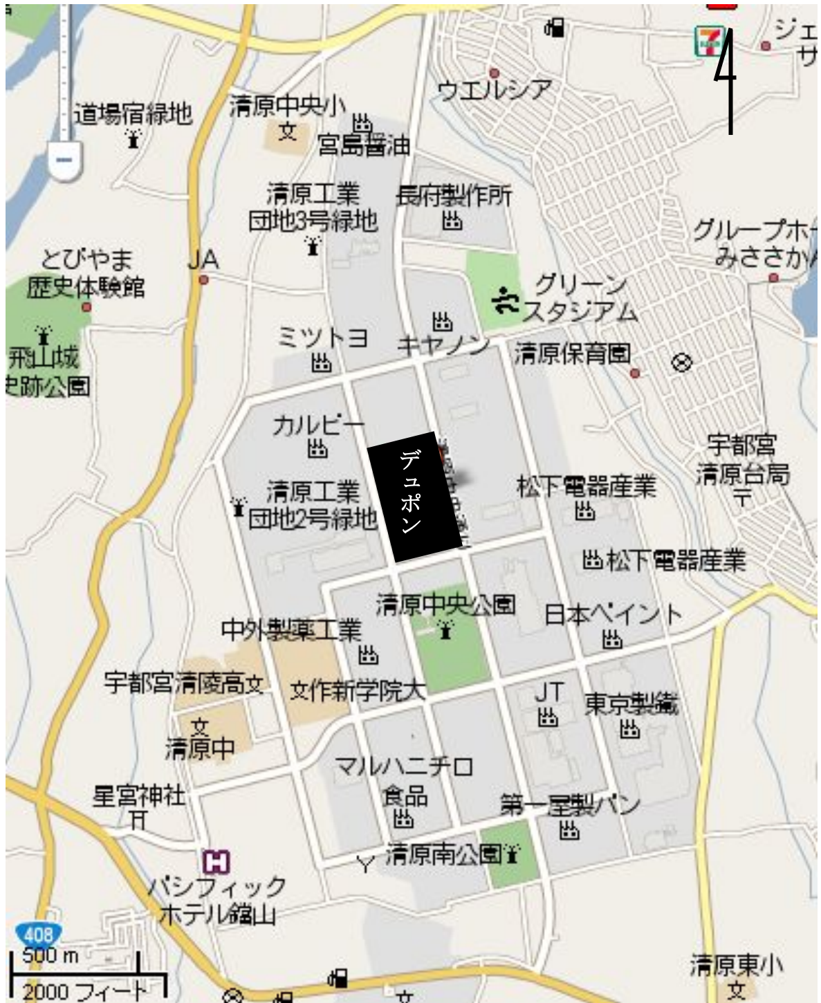
デュポン株式会社 宇都宮事業所周辺地図