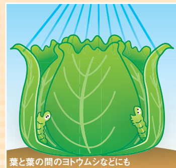
葉と葉の間のヨトウムシなどにも