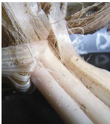
にらの根部に寄生したネダニ