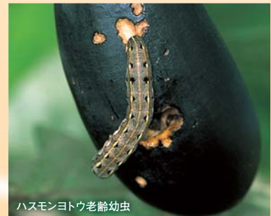
ハスモンヨトウ老齢幼虫

秋に発生するハスモンヨトウ、ウワバなどの大型チョウ目害虫は、トルネード®で上手に防除しましょう。